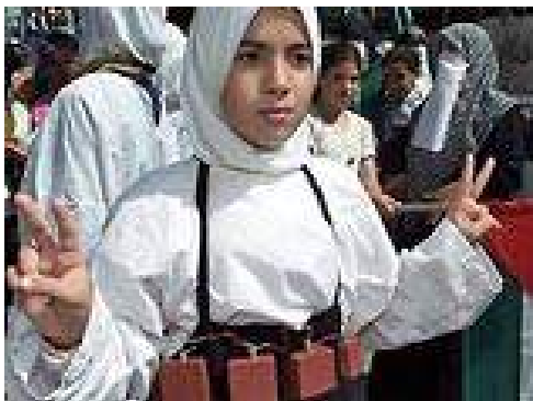
Рис. 12. Она готова стать террористкой

Непосредственную работу с потенциальным шахидом проводят «штатные» психологи террористических организаций.