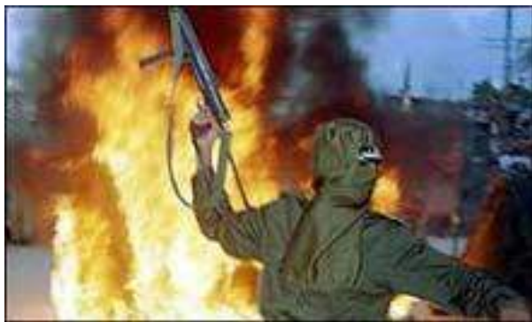
Рис. 4. Современный облик терроризма

Сегодня наблюдается резкий всплеск и качественные преобразования терроризма. Терроризм значительно расширил свою географию, охватил Латинскую Америку и Азию. Он обрел черты наступательности, высокой технической оснащенности, отличается изощренностью и жестокостью.