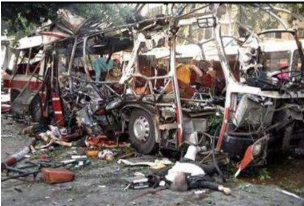
Рис. 3. Взрыв автобуса с людьми в Израиле

- политические похищения, имеющие целью добиться определенных политических условий, освобождения из тюрьмы сообщников и т.д.;