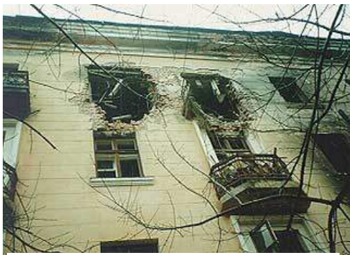
Рис. 5. После взрыва в доме

Печальная статистика жертв террористических актов не обошла и нашу страну. До распада СССР и обострения национальных конфликтов терроризм в нашей стране был весьма редким явлением. Единственный нашумевший случай в 1970-х гг. - это взрыв в вагоне московского метро в январе 1977 года, который унес более десяти жизней. Начиная с начала 1990-х гг. ситуация кардинально изменилась.