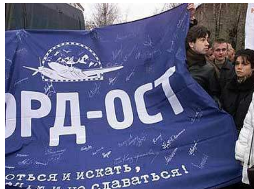
Рис. 6. Люди осуждают террористов

2004, 31 августа рядом со станцией метро «Рижская» террористка-смертница привела в