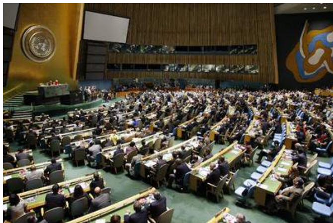
Рис. 9. Страны ООН - против терроризма

Сегодня на первый план выдвигается борьба против международного терроризма, который стал главной угрозой жизни и здоровью людей, а также стабильности мировой экономической и политической систем. Активные шаги в этом направлении проводятся на различных уровнях. На уровне глав государств и правительств, спецслужб, вооруженных сил, политических и общественных организаций и движений.