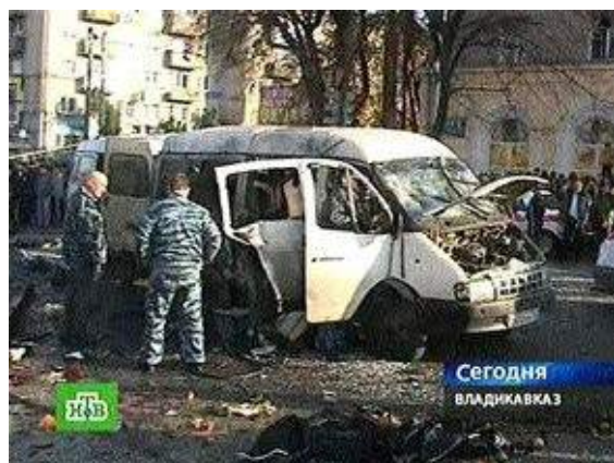
Рис. 7. Взрыв маршрутного автобуса

действие взрывное устройство мощностью до двух килограммов в тротиловом эквиваленте. 10 человек погибли, более 50-и получили ранения.