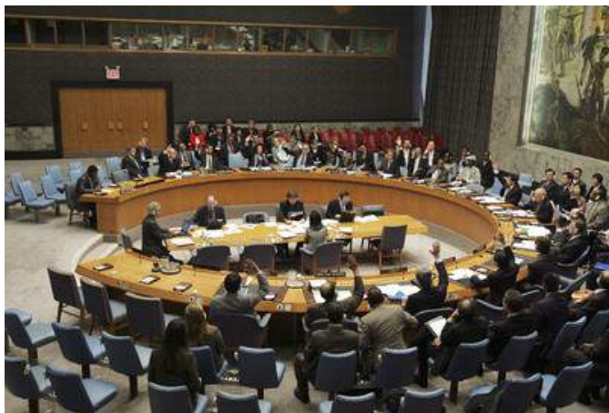
Рис. 10. Совет безопасности обсуждает проблему противодействия терроризму

Департамент по вопросам разоружения (ДВР) занимается созданием и ведением единой базы данных по биологическим инцидентам, которая содержит детальную информа-