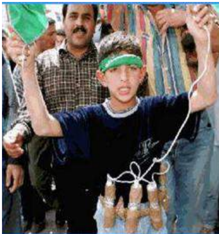
Рис. 8. Он уже готов проститься с жизнью («пушечное мясо» главарей терроризма)

б) людей неквалифицированных в профессиональном плане, но имеющих те или иные причины примкнуть к террористам (идеологические, материально-бытовые, стремление избежать уголовной ответственности за совершенные ранее преступления, отомстить за что-то властям). Эта категория представляет «пушечное мясо», рассчитанное либо на одноразовое использование, либо на непродолжительный срок пребывания в рядах террористов.