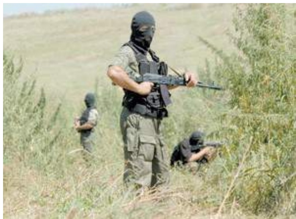
Рис. 11. Специальное подразделение проводит контртеррористическую операцию

На антитеррористические комиссии возлагаются функции координации деятельности территориальных органов исполнительной власти и органов местного самоуправления по профилактике терроризма, а также по минимизации и ликвидации последствий его проявлений. Комиссии возглавляют высшие должностные лица субъектов Российской Федерации.