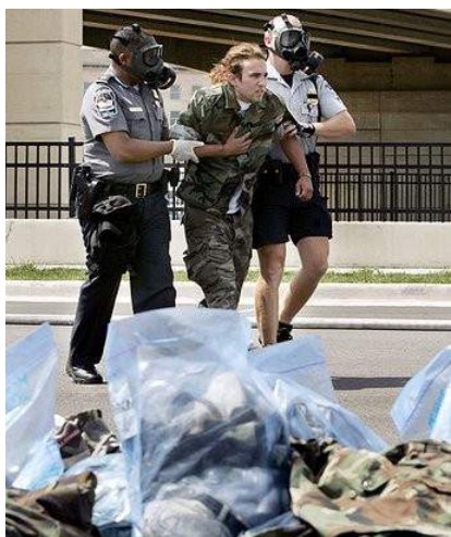
Рис. 13. Оказание помощи после взрыва

Необходимо помнить, что метро (помещения, вагоны) – это замкнутые пространства. Во-первых, здесь затруднены, а порой, невозможны свободные перемещения вследствие давки из-за паники, остановки поезда в тоннеле и т.п. Во-вторых, взрыв в замкнутом пространстве гораздо опаснее, чем на открытом воздухе, так как взрывной волне, образуемой давлением распространяющегося газа, некуда уходить, и она причиняет гораздо больше вреда, чем на открытом пространстве.